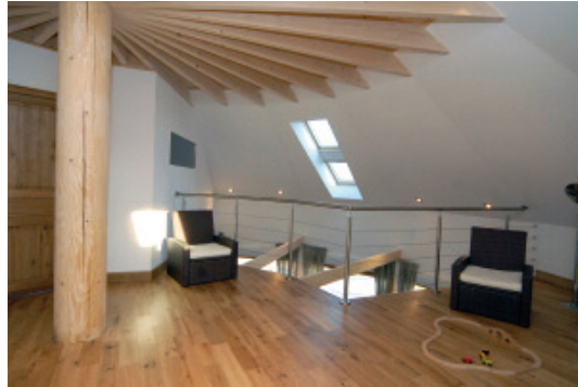
Trois chambres de 13 m 2 chacune, accueillent habitants et visiteurs, dans une décoration sobre, claire et somptueuse à la fois.