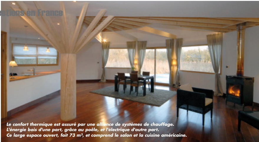
Le confort thermique est assuré par une alliance de systèmes de chauffage. L'énergie bois d'une part, grâce au poêle, et l'électrique d'autre part. Ce large espace ouvert, fait 73 m 2 , et comprend le salon et la cuisine américaine.