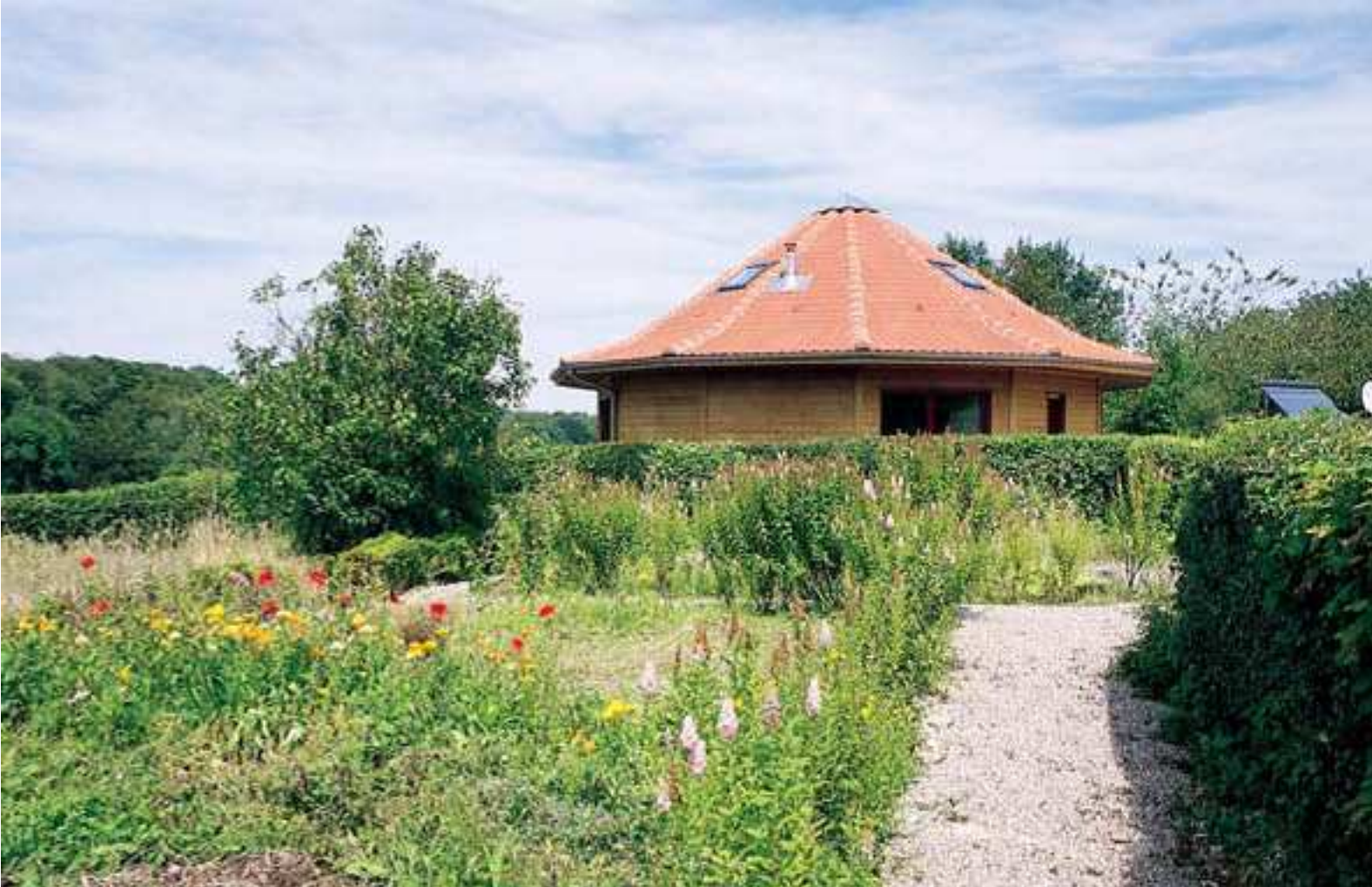
En ossature bois, la structure de la maison est en sapin du nord de Scandinavie, issu de plantations respectant l'écologie. Le bardage est en sapin thermo-traité. Les menuiseries en aluminium sont thermolaquées en bordeaux.